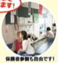
保護者参観も自由です!