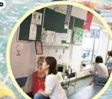
保護者参加も自由です!